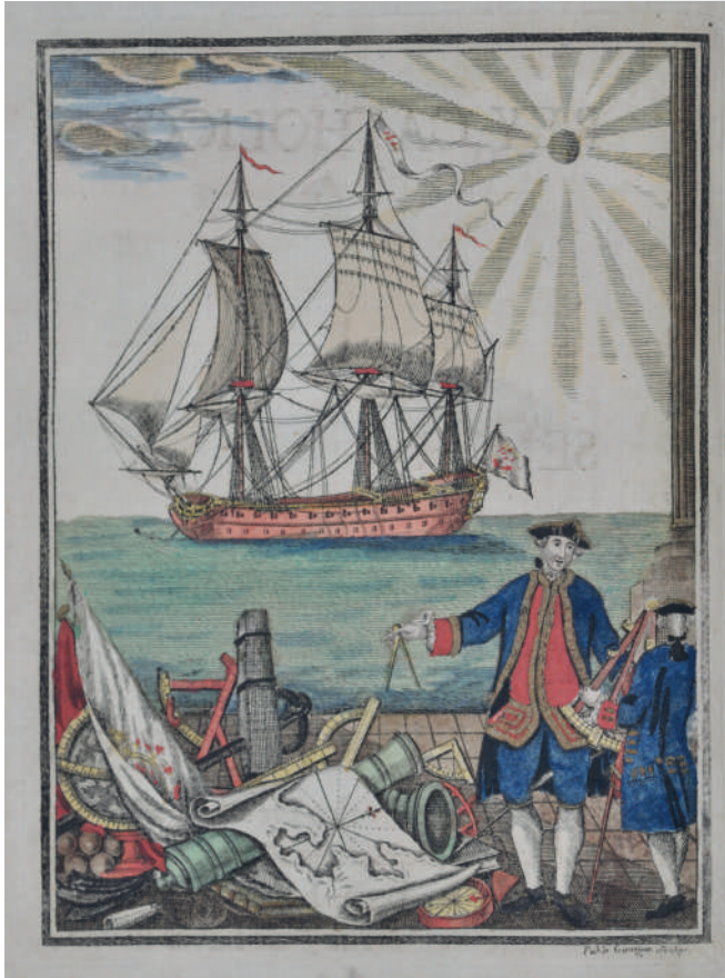
Alegoría del nuevo marino científico